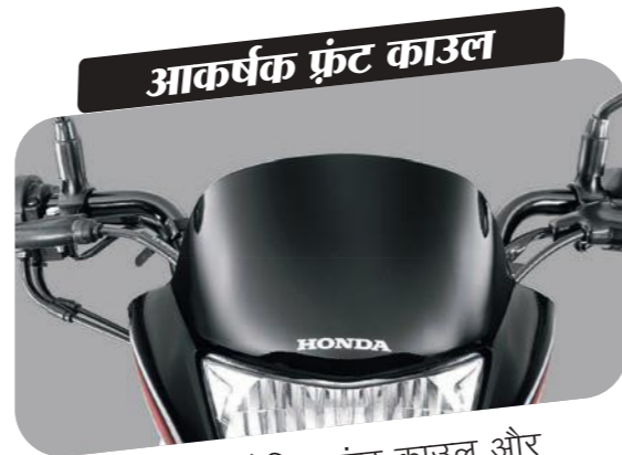
आकर्षक फ्रंट काउल

टैंक के साथ साइड ग्राफिक्स की खूबसूरती बढ़ाए आपकी शान।