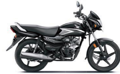
ग्रे के साथ ब्लैक

अभी ऑनलाइन बुक करें! www.honda2wheelerindia.com