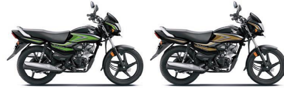
ग्रीन के साथ ब्लैक गोल्ड के साथ ब्लैक