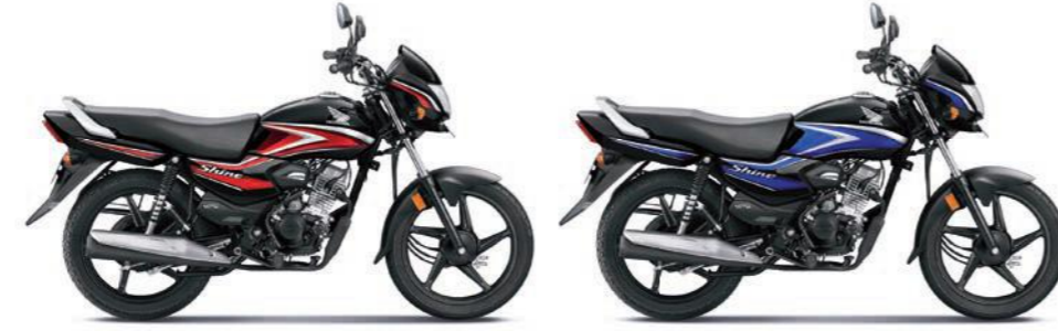
रेड के साथ ब्लैक ब्लू के साथ ब्लैक